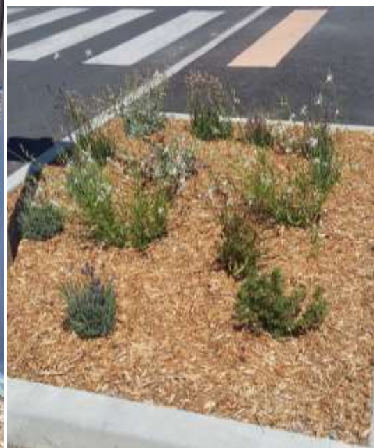
Photo 8 et photo 9 : espèces méditerranéennes des espaces extérieurs, nécessitant peu d'arrosage et faisant référence aux simples (flore médicinale) : lavande, hélichryse, romarin, hysope...