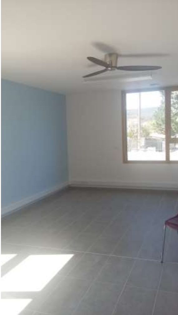
photo 6 : des locaux eco conçus, sans climatisation mais avec ventilation