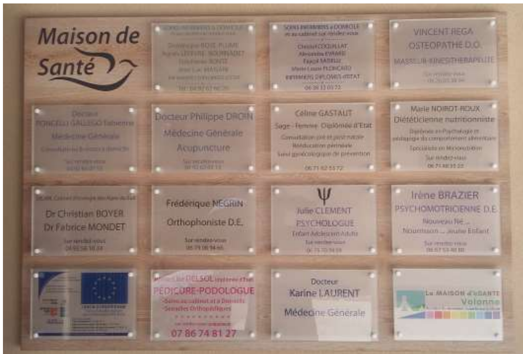
Photo 15 : plaque des professionnels de la Maison de Santé (juin 2019)