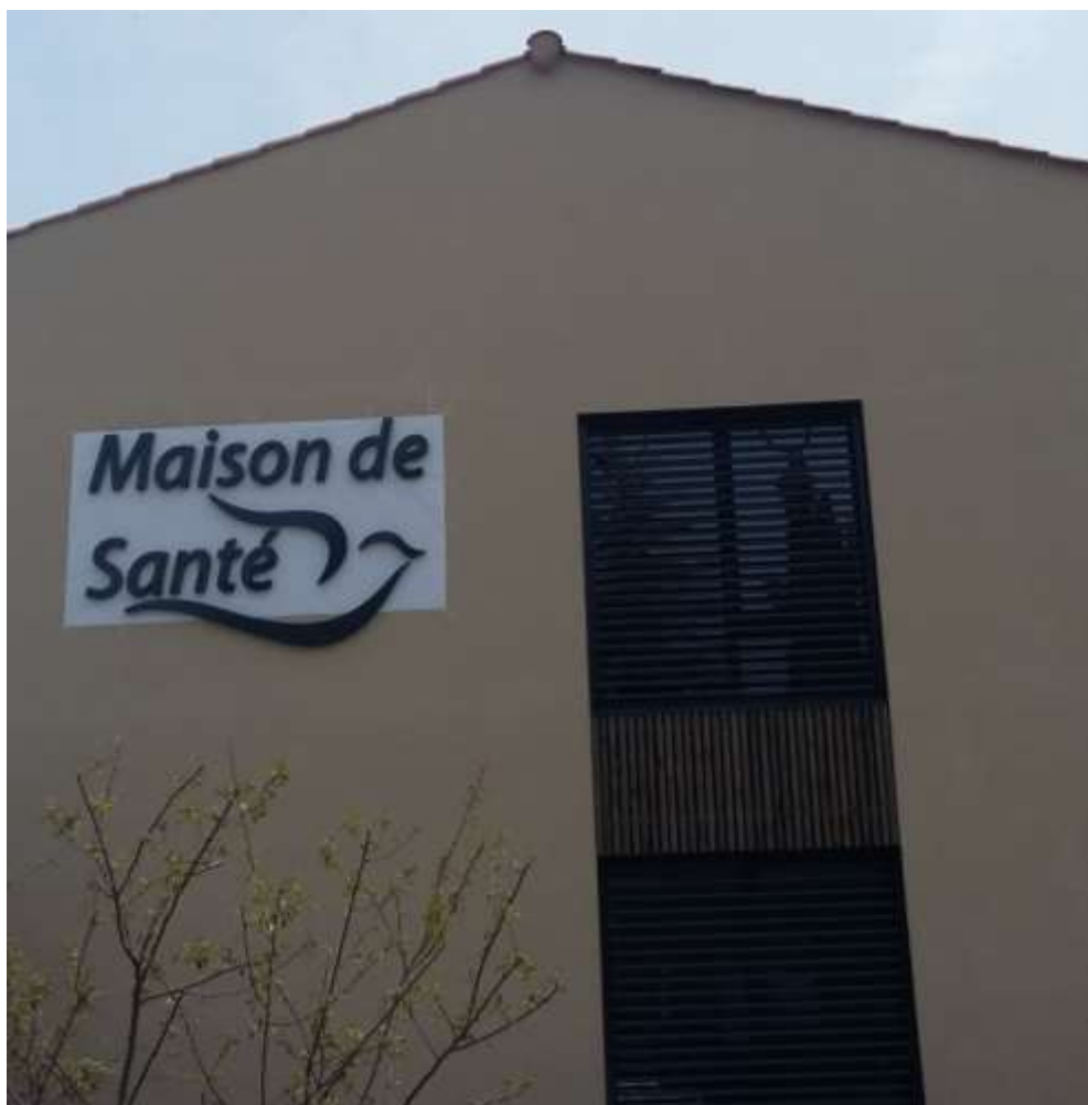
Photo 12 : le logo de la maison de santé, rappel de l'ambition ornithologique de l'écoquartier (juin 2019)