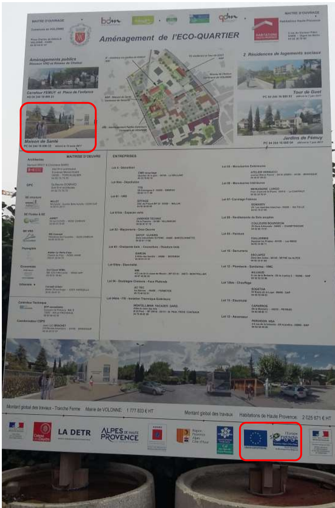
Photo 20 : un seul panneau présente l'écoquartier dans toute sa cohérence. Le détail des financements par bâtiment est affiché pour chacun d'eux à l'intérieur.