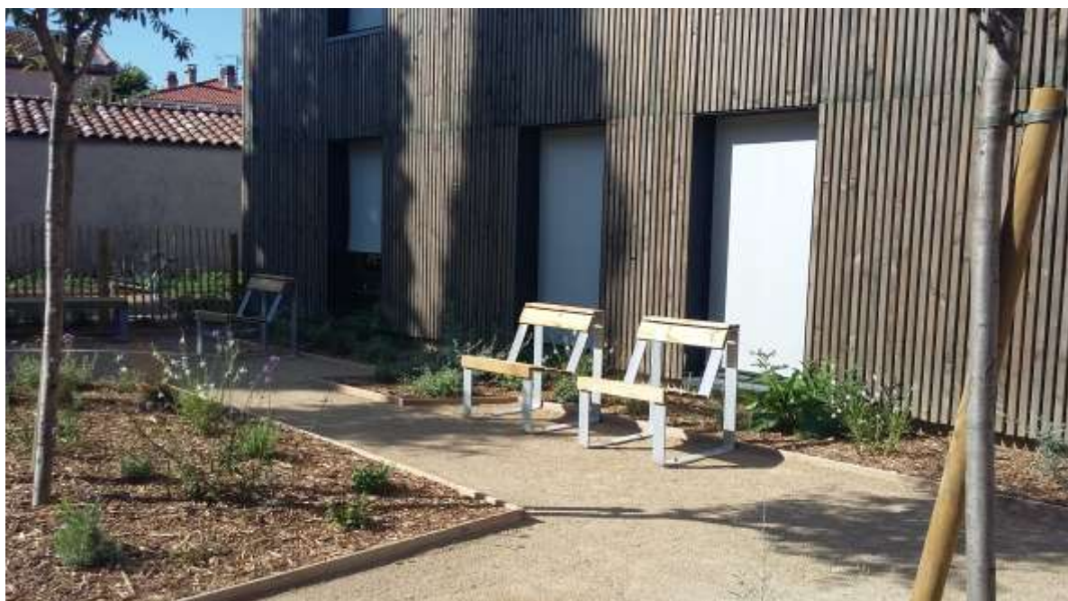
Photo 13 : "le jardin intime" qui sera dissimulé à la vue par les oliviers de Bohème (juillet 19)