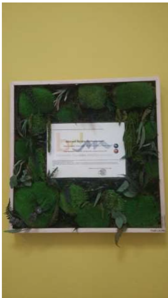
Photo 16 : mention des labels BDM : argent en phase conception et or en phase réalisation, encadré dans une création végétale de mousse naturelle (février 2020)