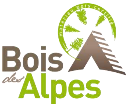
Photo 2 : logo bois des Alpes, certifiant la construction en ossature bois