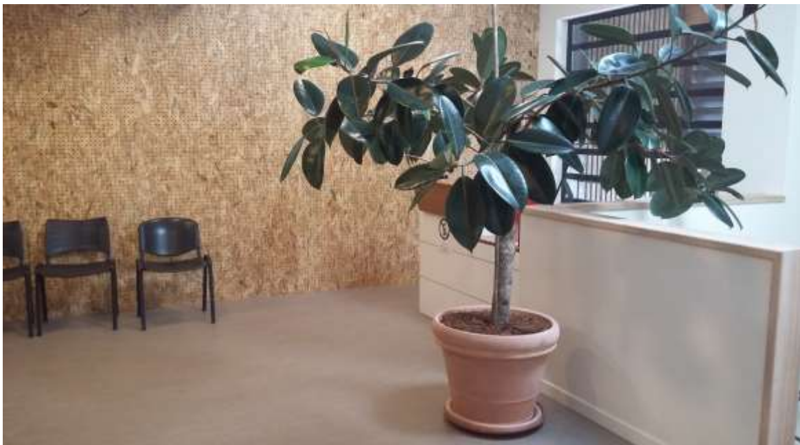
Photo 5 : salle d'attentes des spécialistes, traitement acoustique et thermique (juin 2019)