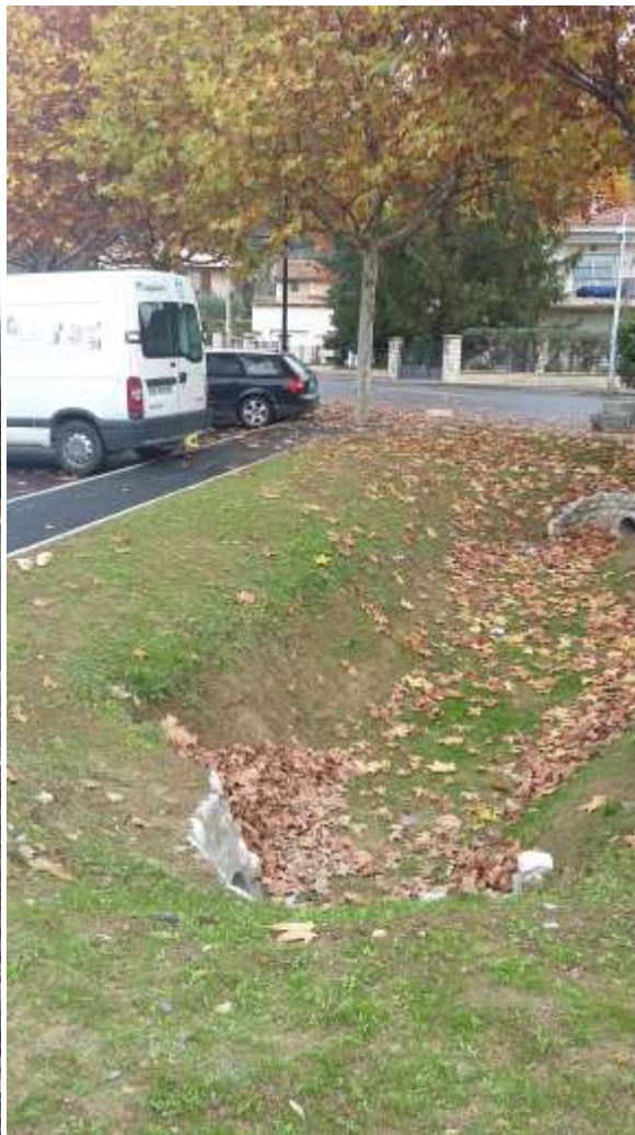
Photo 10 : soin des espaces extérieurs arbres, locaux (novembre 2018)