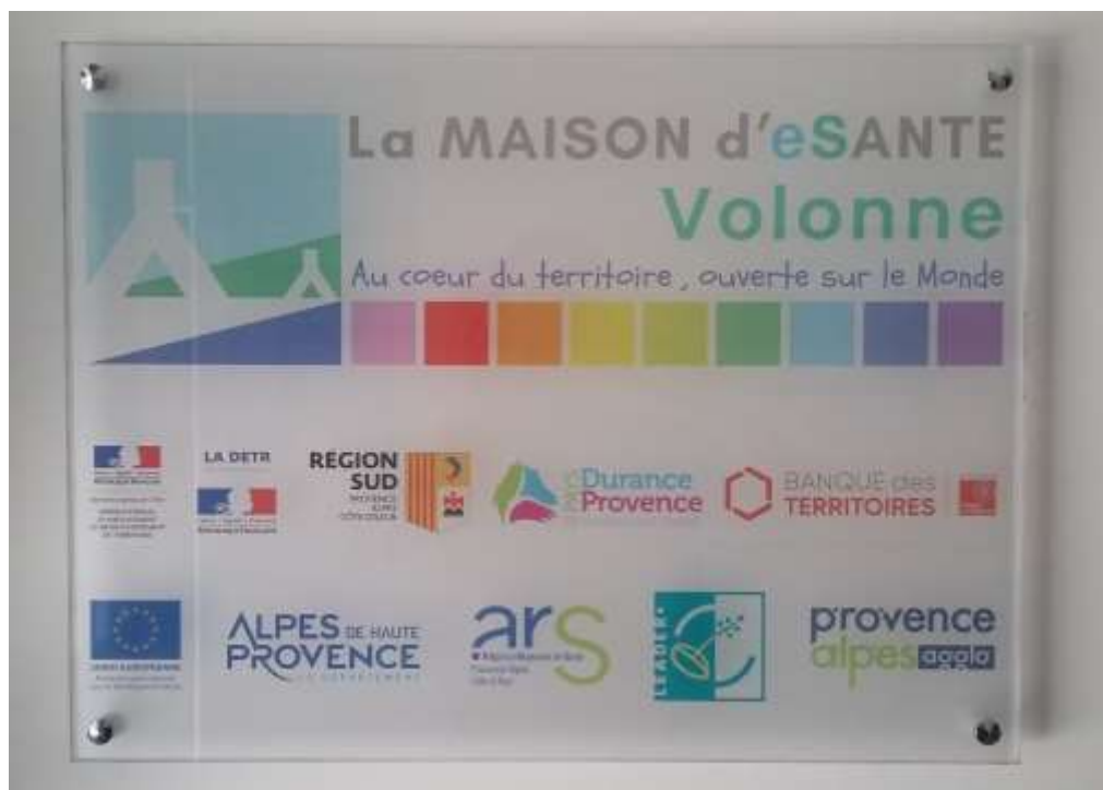
Photo 19 : plaque des partenaires techniques et financiers de la Maison de Santé (juin 2019)

Voir état récapitulatif des dépenses visé par le trésorier payeur général.