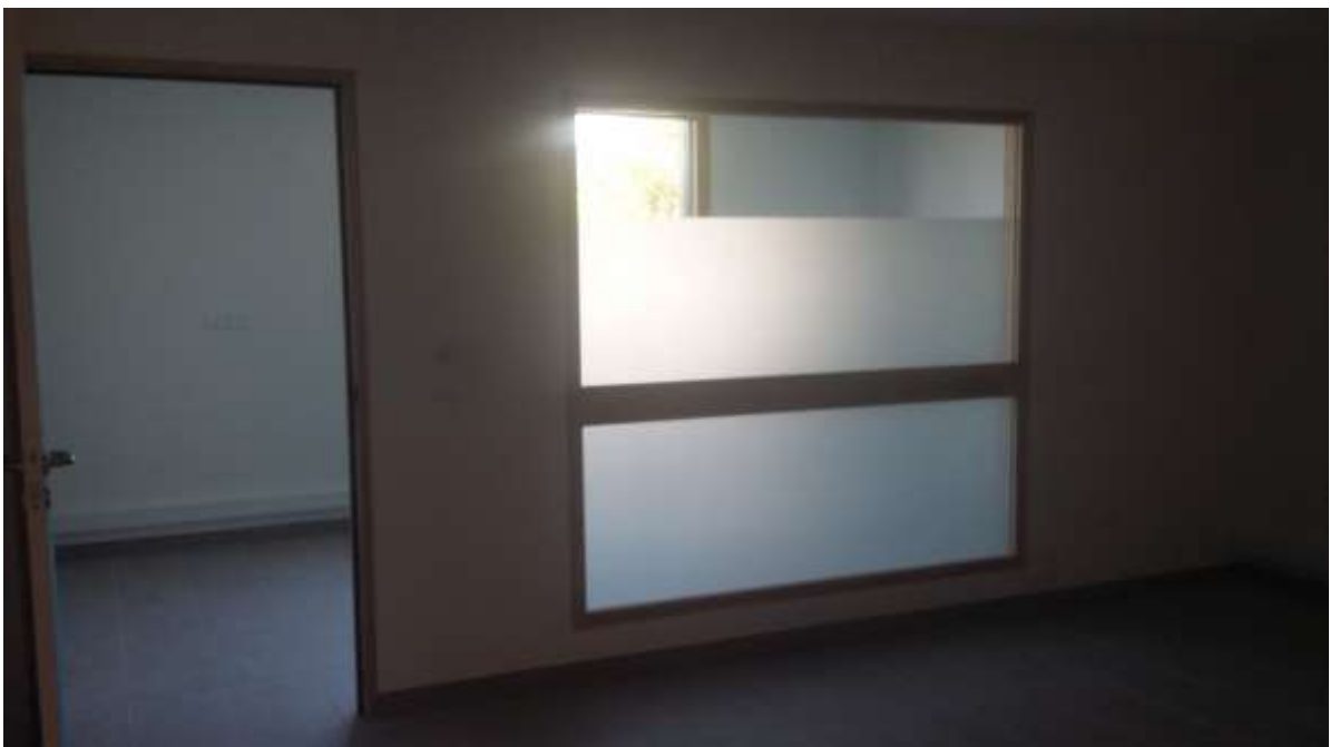
Photo 7 : des locaux conçus avec les professionnels, adaptés à leurs besoins